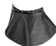
Leather welding bib

Автоматический сварочный светофильтр с технологией автоматического затемнения LiFE+ Color обеспечивает повышенную четкость обзора. Регулировка степени затемнения: 5, 8, 9–13 и 14, 15.