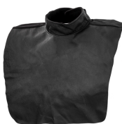
Universal leather neck protector

Дополнительная интегрированная защита шеи для моделей Alfa и Beta серии e. Кнопки-застежки облегчают снятие и установку.